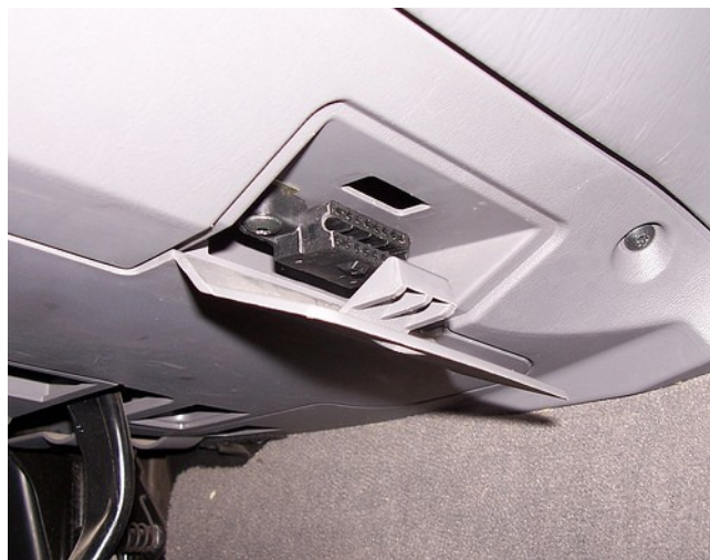
Annat exempel på uttagets placering bakom lucka